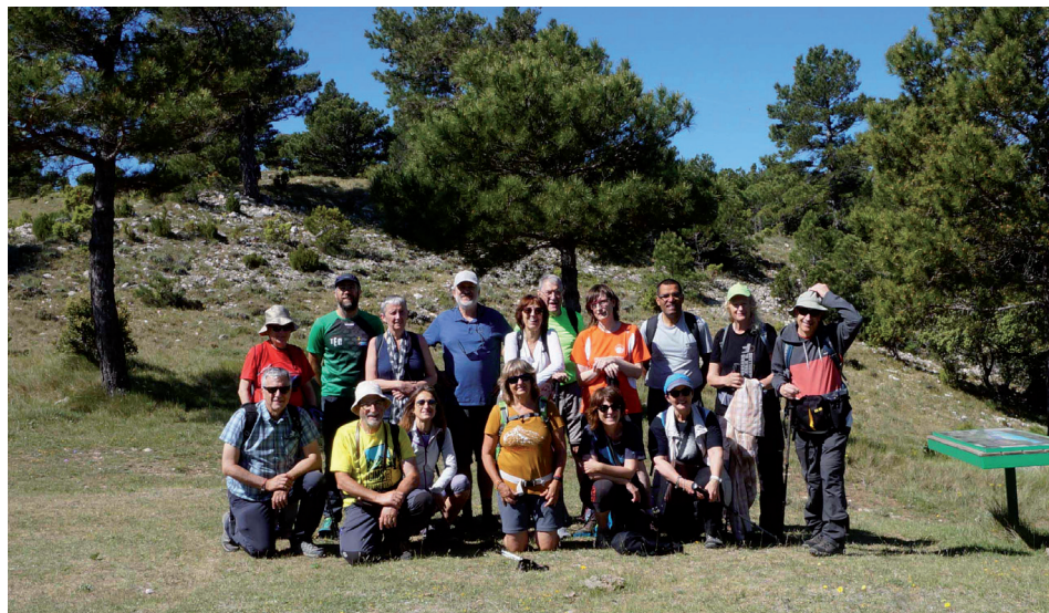
El grup excursionista a l'Ereta de Bel

territori per Jaume I, passà a formar part de la Tinença, dins del nou regne de València. Actualment, el Ballestar és la segona entitat de població més habitada dins del municipi de la Pobla, amb 35 habitants empadronats l'any 2018. El recorregut pel Ballestar té lloc per uns carrers amb habitatges de pedra vista, majoritàriament ben conservats, tal i com es posa de manifest amb les seves façanes i teulades refetes i ben endreçades que realcen el conjunt d'aquest nucli rural. Fins i tot a la pròpia església, a la qual va accedir el grup, s'hi estaven fent algunes actuacions de millora, tal i com ens informà un dels seus responsables.